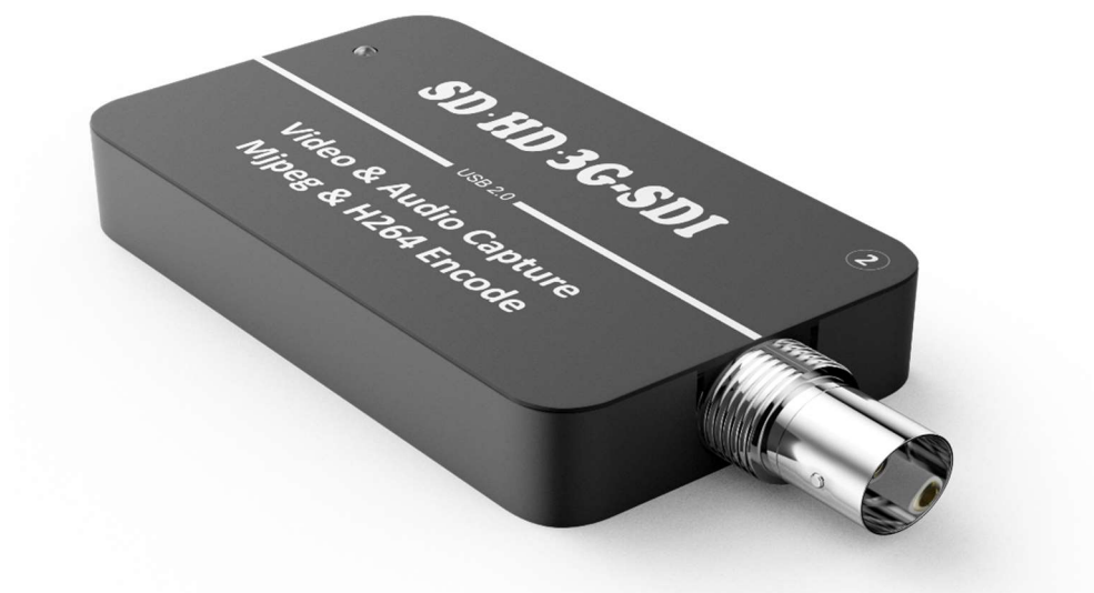
图二：模拟 BNC 输入接口